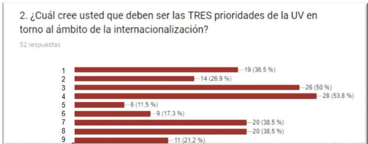
Gráfica 2. Prioridades de la internacionalización en la UV.

A partir de estos resultados podemos notar que existe un claro señalamiento sobre la necesidad de enfocar los esfuerzos de internacionalización hacia la implementación de la dimensión internacional en los programas educativos, llamada también Internacionalización del Currículum, iniciativa que promueve la adquisición de pertinencia curricular en sintonía con las prioridades globales. Dicho rubro recibió el 53% de las menciones, seguido muy de cerca del segundo elemento con mayor importancia para los encuestados, la movilidad de estudiantes, que resulta una estrategia obligada y con tendencia a continuar de manera indefinida en los planes de internacionalización de la Educación Superior.