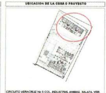
UBICACIÓN DE LA OBRA O PROYECTO

CIRCUITO VERACRUZ No 3 COL. INDUSTRIAL ANIMAS, XALAPA, VER.