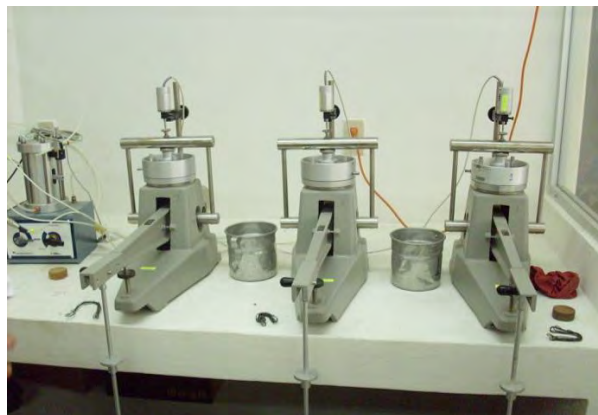
– Equipo de alta tecnología, adquisición recursos PIFI 2004

La facultad posee un proyecto estratégico de vinculación, que define las acciones a seguir en lo referente a este rubro, todas las actividades se encuentran registradas en el Sistema Institucional de Vinculación Universitaria (SIVU). La formación disciplinar de los profesores del PE ha permitido prestar servicios relacionados con mecánica de suelos, estructuras, hidráulica, topografía, control de calidad a materiales; siendo los sectores público y privado, así como el social, los beneficiados con estos servicios. Esta actividad ha permitido lograr la obtención de recursos en especie como climas, consumibles para laboratorio y maquinaria, además de la experiencia profesional de los alumnos que participan en estos proyectos.