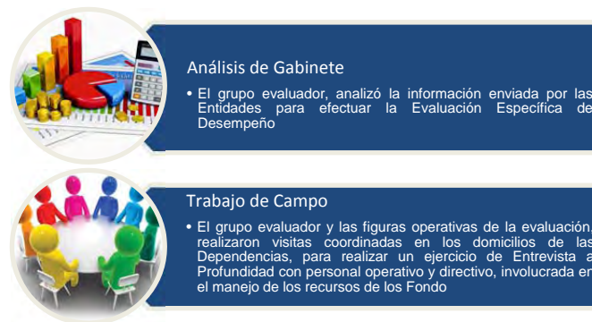
Figura 1. Evaluación de gabinete y de campo