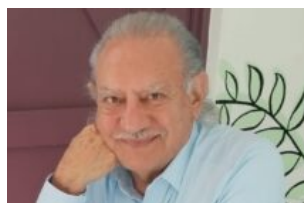
Bomba nuclear judicial y su acordeón