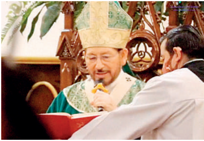
Arzobispo de Xalapa, Hipólito Reyes Larios.

La celebración estuvo a cargo del párroco de Catedral, Roberto Reyes Anaya, donde hubo restricciones sanitarias, debido a que Xalapa se