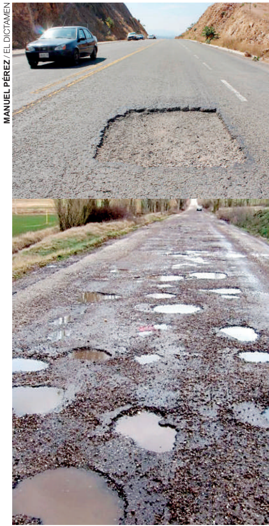
Ante las condiciones desastrosas en que se encuentran las carreteras, repletas de baches urge el regreso de la Junta Local de Caminos de Veracruz.