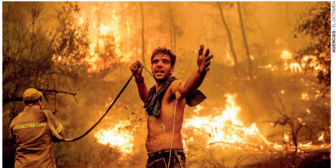
Grecia vive un drama que hasta el momento no se ha podido controlar, la gente teme no sólo por sus bienes, sino también por sus vidas.

Una denuncia internacional no será suficiente. Es prioritario limpiar la corrupción que impera en las aduanas. A la par se deben fortalecer las capacidades de las autoridades y policías locales, con el fin de evitar el amedrentamiento que hacen los delincuentes a los funcionarios mexicanos. Hay que aplaudir la acción anunciada por Ebrard, sin embargo hay que ir mucho más allá. Un nuevo espacio de diálogo con el gobierno estadounidense derivado de esta acción, deberá ir acompañado de mecanismos mucho más eficientes para cuidar y fortalecer nuestras fronteras. La #SociedadHorizontal tiene la oportunidad de impulsar acciones coordinadas con organizaciones de la sociedad civil del otro lado de la frontera, para empujar una agenda común y desincentivar la venta de armas de asalto.