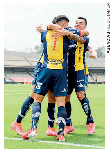
San Luis venció como visitante a Pumas.