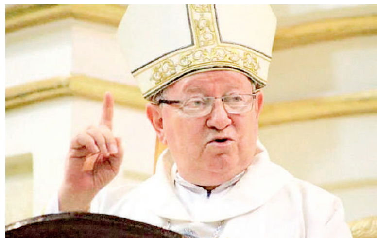
Carlos Briseño Arch. Obispo de Veracruz, hizo un llamado a elevar oraciones por su eterno descanso y para que su familia encuentre la resignación y el consuelo para la irreparable pérdida.