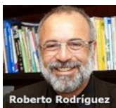
El proyecto de ley de ciencia: retroceso federalista