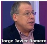
Una aberración en educación