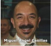
Los derechos digitales de los universitarios