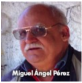
Entender la vida de las escuelas desde una mirada basada en la investigación