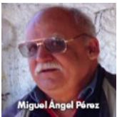
Problemas y tendencias de la educación durante el nuevo siglo