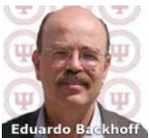
En defensa de la educación