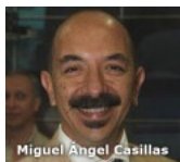
Nuevos derechos para los universitarios