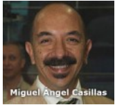
Nuevos derechos para los universitarios