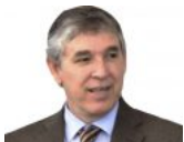
No debo reprobar a mis alumnos