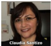
La cancelación de Escuelas de Tiempo Completo revela el pulso de la política de antes y de ahora