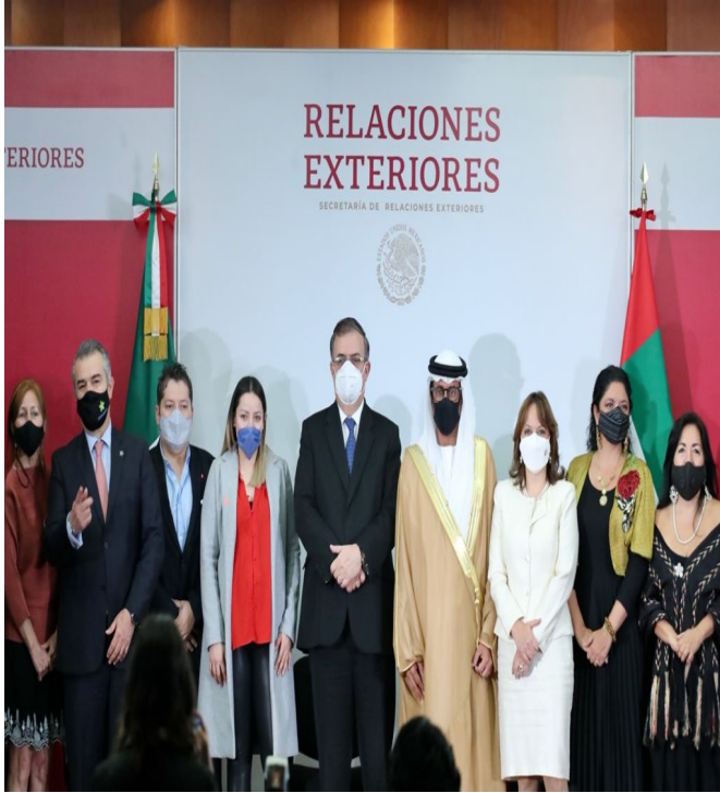
ESTOY ENFOCADO EN SRE, LA SUCESIÓN PRESIDENCIAL "ESTÁ MUY LEJOS": EBRARD