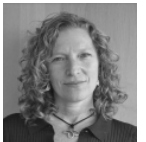
Mediatización del feminismo universitario: El caso de la UNAM