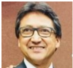
Escuelas de Educación Normal, bien de la Nación