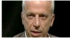
Era un secreto 16 junio, 2021