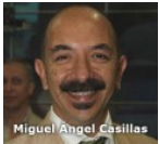
Miguel Ángel Casillas Un nuevo paradigma para la difusión cultural y las artes en la Universidad Veracruzana