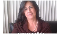
¿Qué piensan y sienten las maestras? 14 junio, 2021