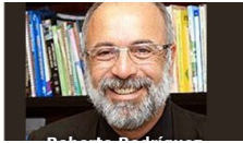
Educación, después de las elecciones 15 junio, 2021