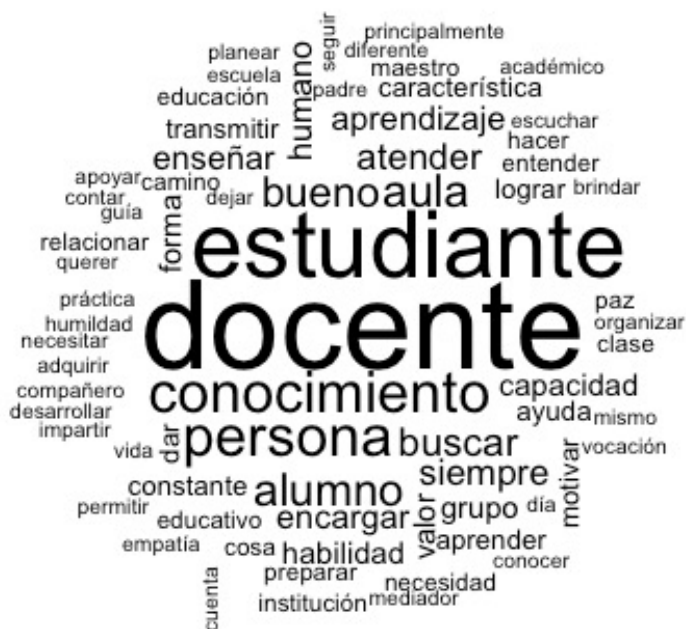
Figura 1. Nube de palabras.

En el árbol de similitud se apreció que el docente es una persona con conocimientos y trabaja con el estudiante. Veamos: