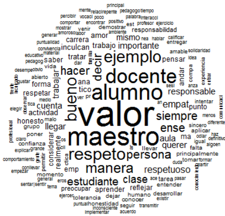
Nota. Nube de palabras. Elaboración propia.

Se puede apreciar que el estudiante relaciona la variable valores con las palabras: valor, docente, alumno, maestro, respeto, persona, manera, estudiante, clase, bueno, siempre, ejemplo, decir, entre otras. Aunado a esto, el estudiante percibe del buen maestro la portación de valores; detaca la empatía y lo definen como aquel que respeta, que es amable, positivo, sincero y tolerante; además, hace que los estudiantes interactúen para aprender y generar mayor conocimiento. El claustro estudiantil menciona que “el docente es puntual en empezar sus clases, conoce los temas que desarrolla al interior del aula, brinda la confianza para que los chicos resuelvan sus dudas y conozcan lo que realmente contribuye a su formación académica” (Astráin, 2019, p. 31), donde las cuestio-