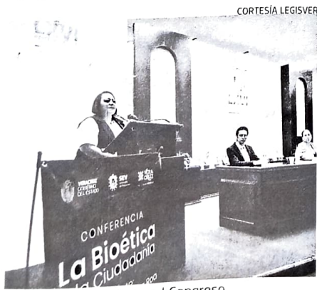
Charla se realizó ayer en el Congreso

La docente en la UV explicó que la comunidad universitaria no escapa de esta situación, este tema se ha estudiado en todos los niveles educativos, de hecho, realizaron un estudio en las escuelas normales de Veracruz que involucra a distintos especialistas, y se detectó que llegan a participar en este asunto de ciberacoso "porque creen que es un juego".