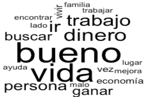
Figura 2. Experiencia buena de la migración