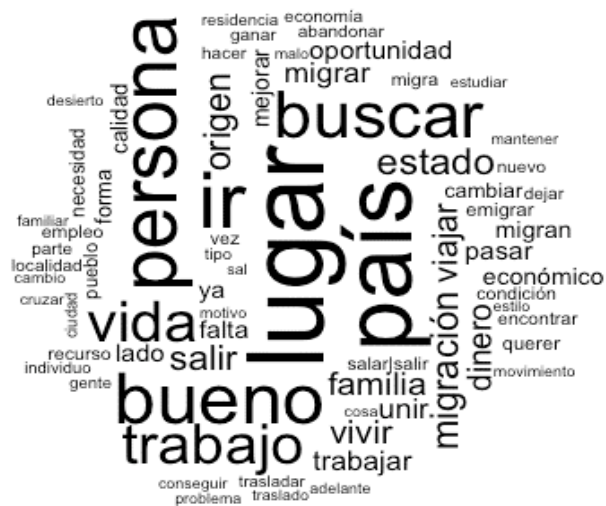
Figura 1. Representación social de la migración