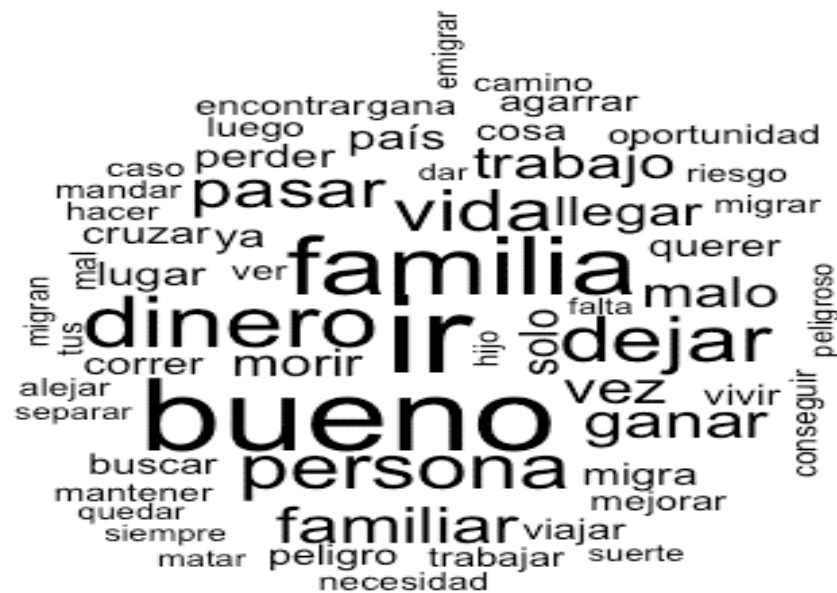
Figura 3. Experiencia regular de la migración