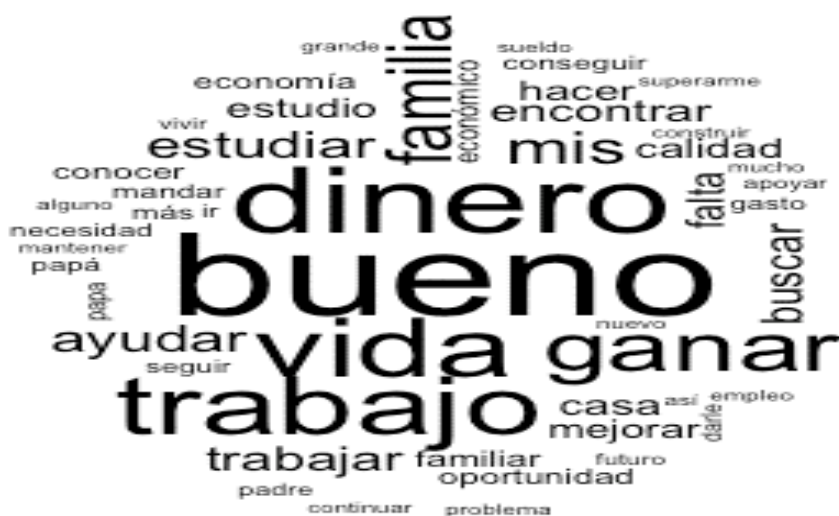
Figura 5. Razones para migrar