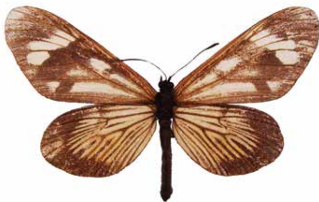
Figura 1. Vista dorsal de Actinote guatemalena veraecrucis Jordan, 1913.