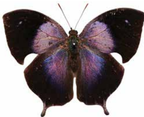
Figura 1a. Vista dorsal y 1b, vista ventral de Memphis schausiana (Druce, 1884).