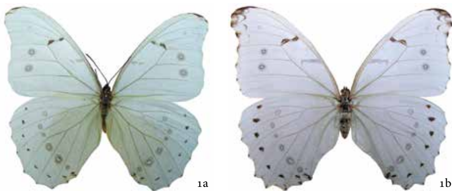
Figura 1a. Vista dorsal macho y 1b, vista dorsal hembra de Morpho polyphemus polyphemus Westwood [1850] fotos: F. Hernández-Baz.