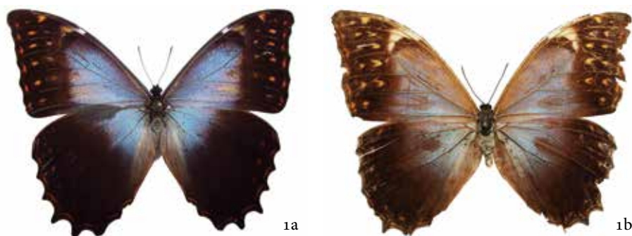
Figura 1a. Vista dorsal macho y 1b, vista dorsal hembra de Morpho thesus schweizeri (R. F. Maza, 1987)