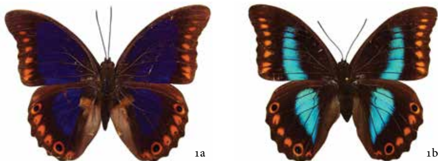
Figura 1a, Vista dorsal macho y 1b, hembra de Prepona deiphile brooksiana (Godman y Salvin, 1889), fotos: F. Hernández-Baz.