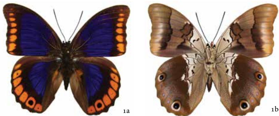
Figura 1a. Vista dorsal y 1b vista ventral macho de Prepona deiphile escalantiana Stoffel y Mast, 1973, fotos: F. Hernández-Baz.