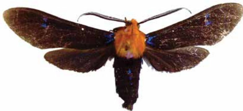
Figura 1. Vista dorsal macho de Scena propylea Druce, 1894, foto: F. Hernández-Baz.