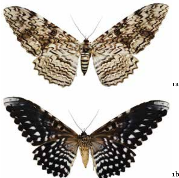
Figura 1a. Vista dorsal macho de Thysania agrippina (Cramer, 1776), figura 1b, vista ventral, fotos: F. Hernández-Baz.