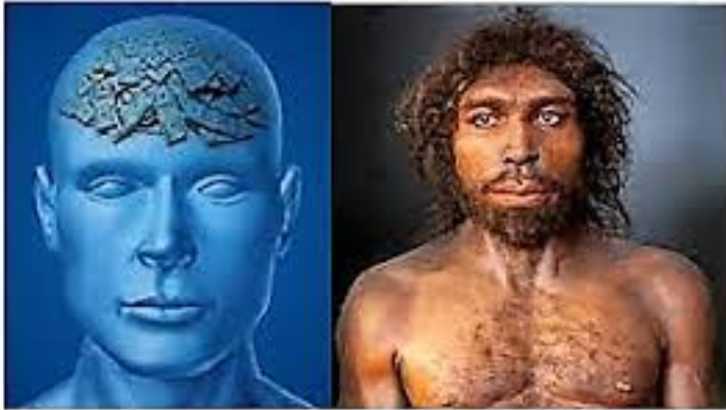
Homo Economicus versus Homo Sapiens