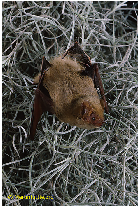
Murciélago Lasiurus ega postrado sobre un cúmulo de heno o pastle ( Tillandsia usneoides ).

Este trabajo fue posible gracias al Consejo Nacional de Ciencia y Tecnología a través del estímulo económico recibido durante los estudios de posgrado de ILLC (Núm. De Beca: 1018336).