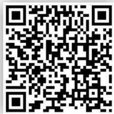
Figura 2. Ejemplo de una de las hojas de trabajo de los saberes digitales que presentamos en el anexo del libro, que se pueden