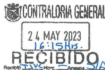
ARTURO INGRAM RANGEL