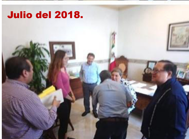
Julio del 2018.