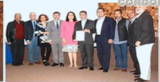
Examen de Maestría Enero 2017