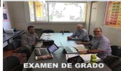
EXAMEN DE GRADO