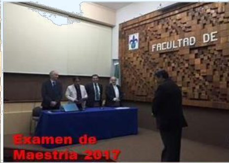
Examen de Maestría 2017