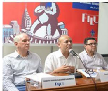
PREMIO AL DECANO 2018.

PROPUESTO POR LA FACULTAD DE ARQUITECTURA DE CÓRDOBA PARA PARTICIPAR EN EL PREMIO AL DECANO 2018