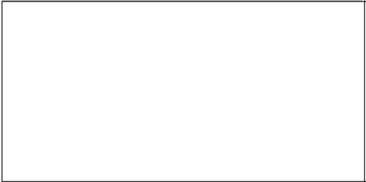
Figura 1. Título de la figura, tipografía Gill Sans negrita, 10 pts., con interlineado de 12 pts. Referencia: tipografía Gill Sans a 10 pts., con interlineado de 12 pts.; precisar si fue tomada o adaptada de alguna fuente y colocar la referencia: Tomada de: "Título de la referencia" por Autor (es). Año, Título . Página.