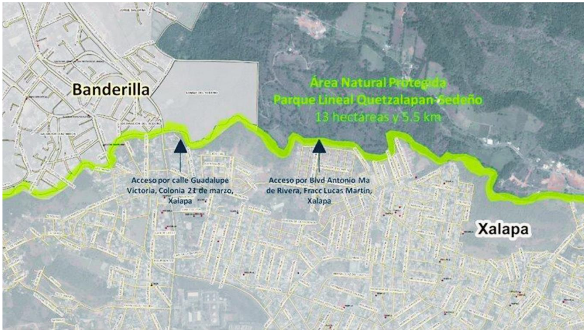
Imagen 1. Mapa de la ubicación del Río Sedeño