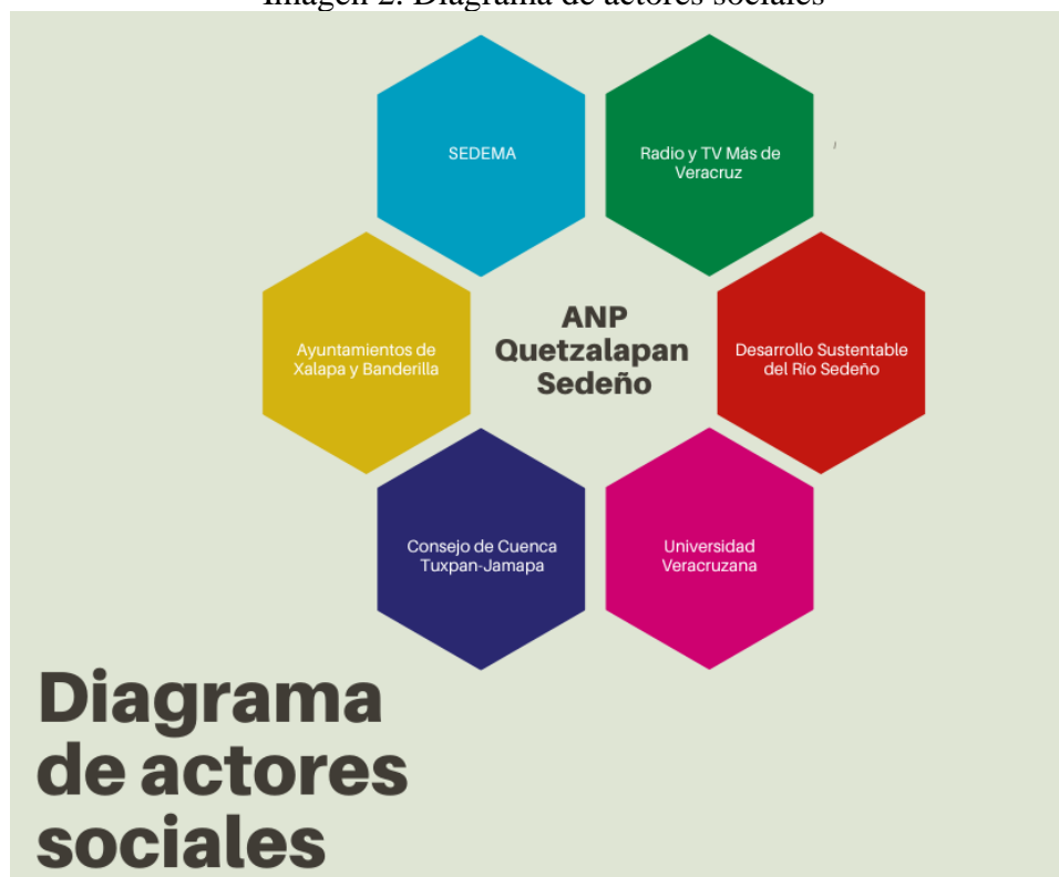
Imagen 2. Diagrama de actores sociales