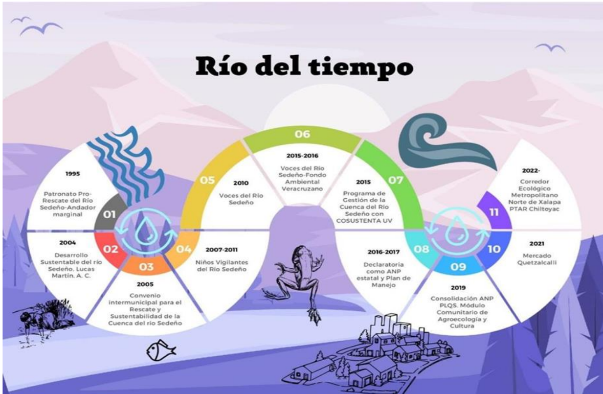
Imagen 4. Río del tiempo. Muestra el proceso y los logros de la A.C.