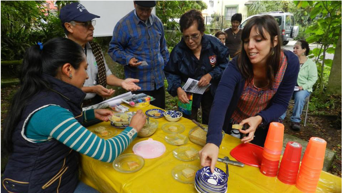
Taller bosque comestible comunitario para Fracc. Lucas Martin, Xalapa, Ver. Abril 2016

Para ir finalizando ¿Qué propuestas de mejora sugiera para proyectos como estos?