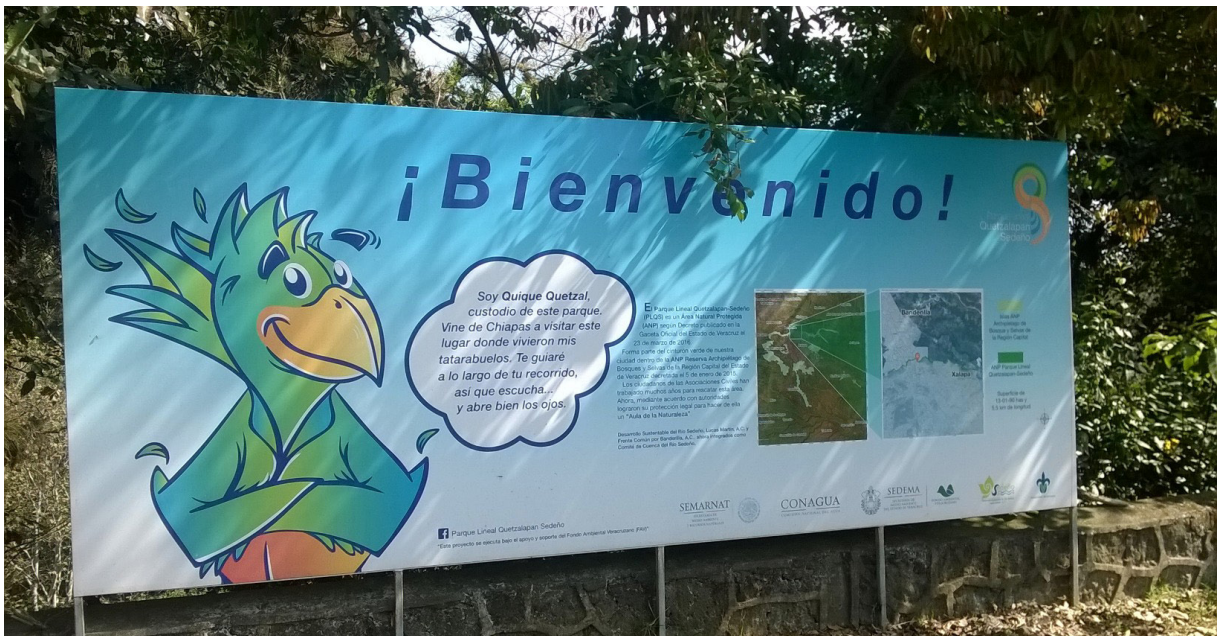
Cartel de Bienvenida al Área Natural Protegida. Calle Gpe. Victoria, Col. 21 de marzo, Xalapa, Ver.

Hay un gran tema que atendemos, en este caso, le llamamos el rescate del río Sedeño en ello puede verse reflejadas parte de las problemáticas de los ríos del estado de Veracruz, de sus cuencas. En este pequeño espacio, son casi 40 Km lineales desde el cofre de Perote hasta Chachalacas. En esta área se hacen evidentes los problemas del crecimiento urbano desordenado, sobre la tala que disminuye la cubierta fores-