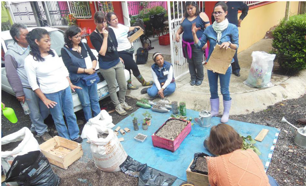
Taller de huertos caseros, junio 2016. Xalapa, Ver.

dadanos interesados y también en medios de comunicación como puede ser esta entrevista y que después se suba a internet o imprimirse o como sea, pero es fundamental para nosotros el proceso de comunicación, intercambio, retroalimentación de esta experiencia.