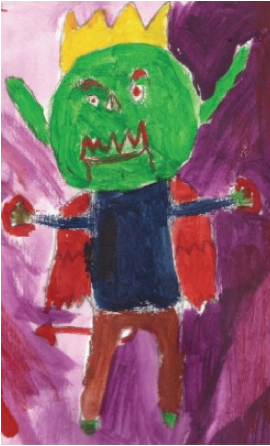
Pintura elaborada por infante del CECAN

tratamiento, el cual no siempre tienen a su disposición en una clínica pública como lo es el CECAN. Eso en el caso del CECAN, el caso del río Sedeño, del parque Quetzalapan Sedeño, ellos no tenían pensado desarrollar una comunicación visual, en algún momento lo que me pidieron es que les apoyan en hacer un cartel, el cual es un concepto bastante extendido en otras disciplinas que a lo mejor no saben cuáles son las otras posibilidades de articular nuestro trabajo con todas las experiencias y situaciones que se nos presenten en dentro de un proyecto. Entonces pues es lo que venimos haciendo con ellos es trabajar desde la señalética que ya tenían contemplando se les propuso hacer una imagen del parque junto con lo que se empezó a desarrollar infografías y cualquier tipo de comunicaciones, manteniendo