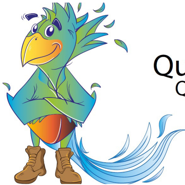
Mascota del Área Natural Protegida Parque Lineal Quetzalapan Sedeño, diseñado por alumnos de la Facultad de Artes UV

viven enfrente del Río Sedeño, a partir de ello ellos se acercaron a mí, "sí, necesitamos un cartel ¿Quién no lo puede hacer? ¡Ah! pues a mi hija". Entonces al final del día le encontré muchísimas posibilidades, mas allá de que desarrollara un cartel como tal; pues dije este es un proyecto para que los estudiantes tengan realmente muchas cosas que hacer por la sociedad y que se sientan importantes, entonces creo que esto va mas allá de eso, inmediatamente se los propuse, les dije esto es más que un simple cartel, creo que tenemos un proyecto enorme de comunicación visual yo creo que si nos necesitan y creo que ni siquiera saben que tanto nos necesitan, bueno pues permítanos trabajar con ustedes y proponerles este tipo de situaciones y claro que lo tomaron muy a bien. De lo que me preguntas de la comunidad,