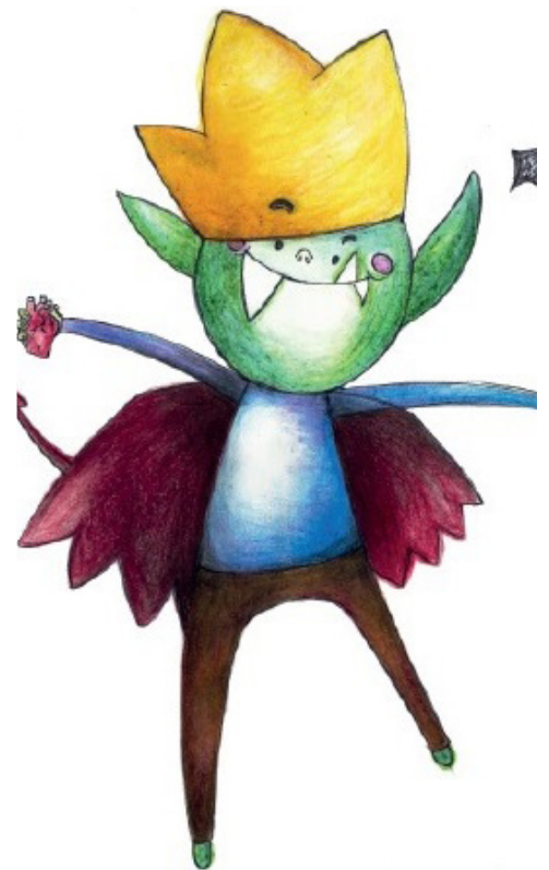
Ilustración producto de la interpretación de las pinturas elaboradas por infantes del CECAN