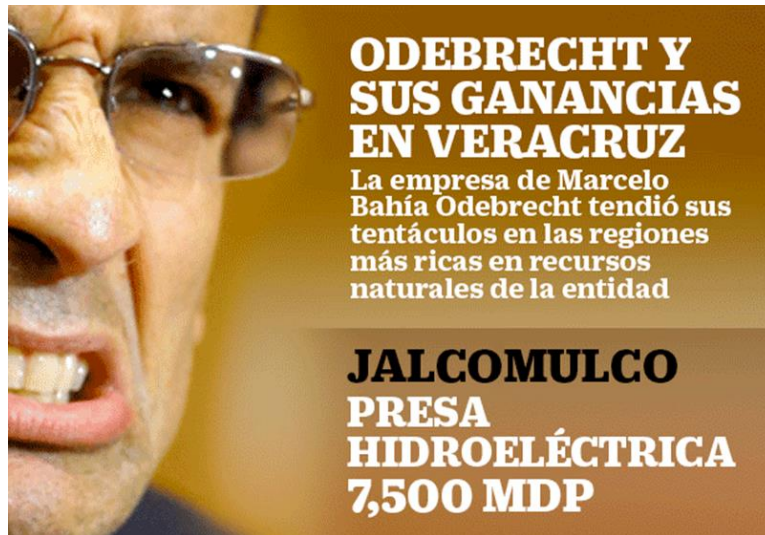
35