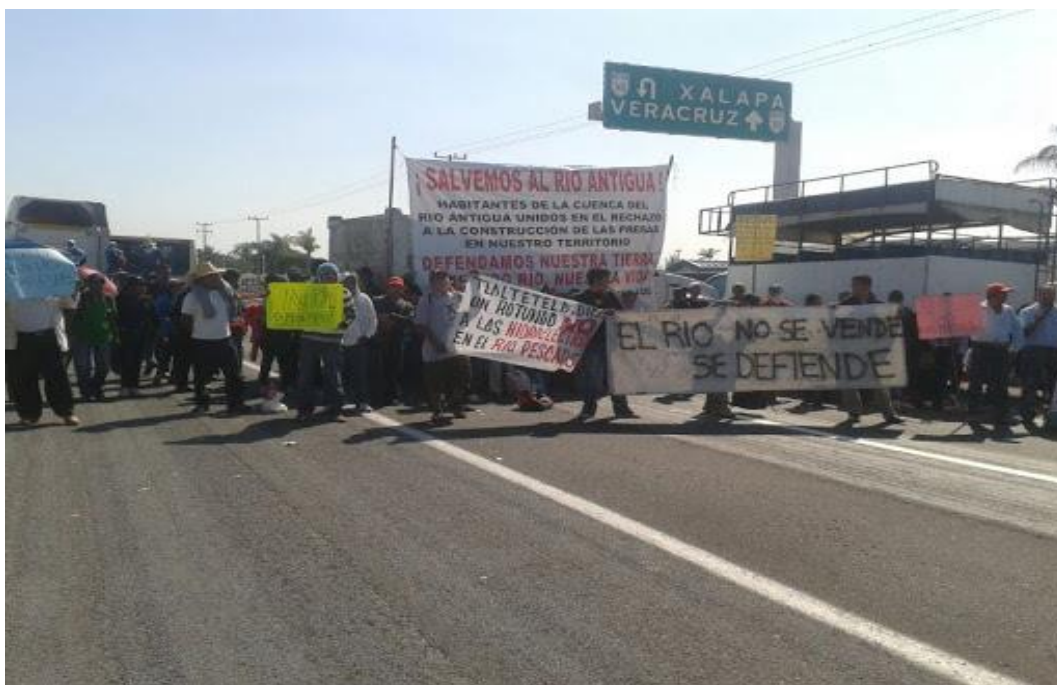
Pobladores opositores a la presa hidroeléctrica en la Cuenca del Río La Antigua 20-01-14 43