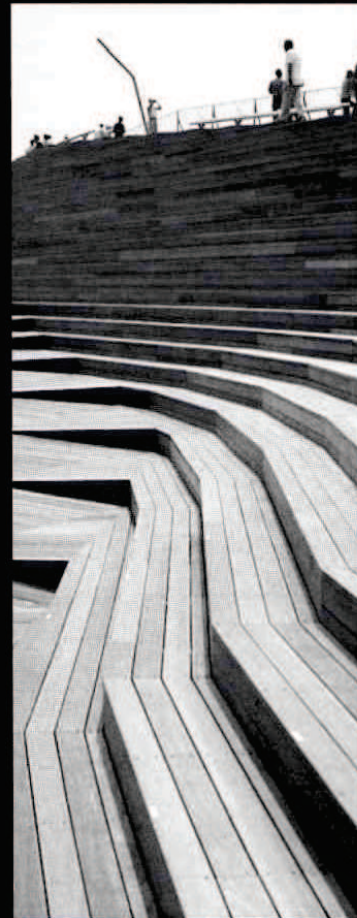
Fig. 55 Yokohama international port terminal- foreign office

Las personas tienen una fuerte percepción del espacio personal, que tan cerca es aceptable estar de los demás. Como menciona Shaftoe, las personas en general se sientan lejos de otros que ya estén sentados en ese espacio. Mientras el espacio se vuelve más concurrido la distribución se comprime más, pero las personas aún intentan maximizar su distancia de los desconocidos o utilizan la posición de sus cuerpos para separarse (como darle la espalda a la persona de al lado o girar la cabeza en sentido contrario al de junto). Es por esto que los asientos movi-