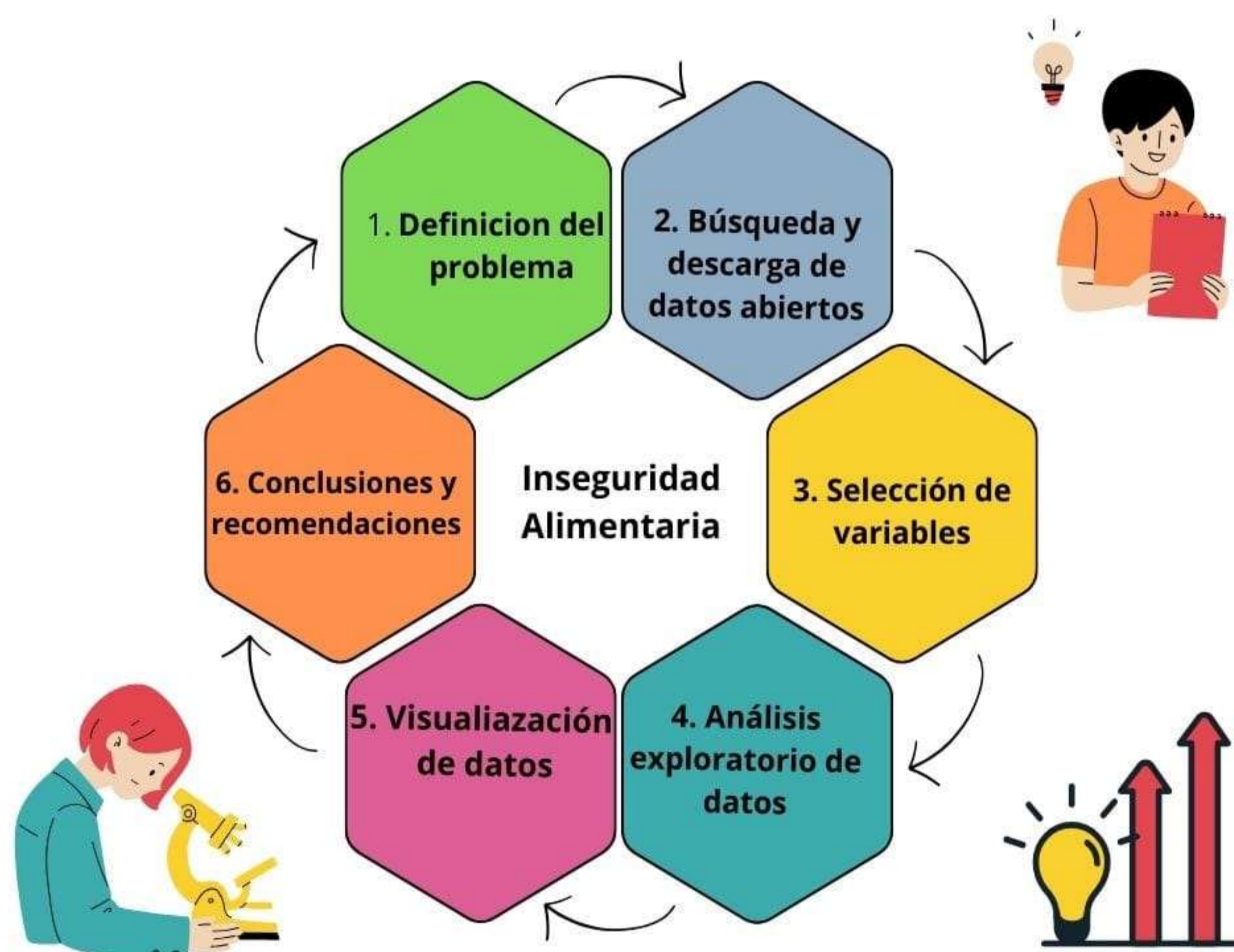
Figura 1. Estrategia para el procesamiento de los datos

Se utilizó la base de datos Indicador ODS 2.1.2a (municipal), realizando primero una limpieza de los datos en Excel y posteriormente realizar un análisis descriptivo y espacial en el software Orange Data Mining .