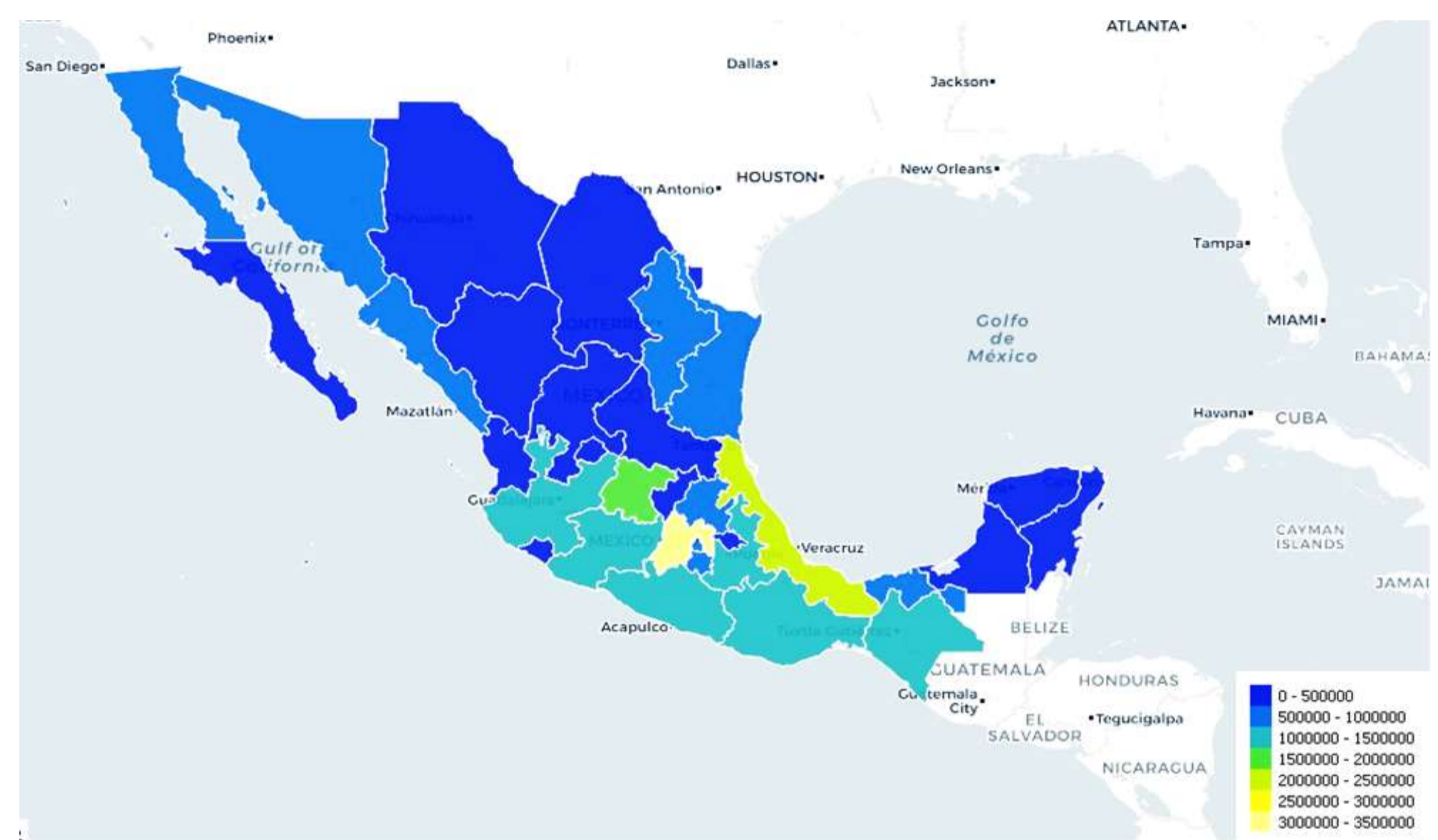
Figura 3. Total de población 2015 con inseguridad alimentaria por entidad federativa.

Los 32 municipios ordenados por la cantidad de mayor a menor población afectada por inseguridad alimentaria