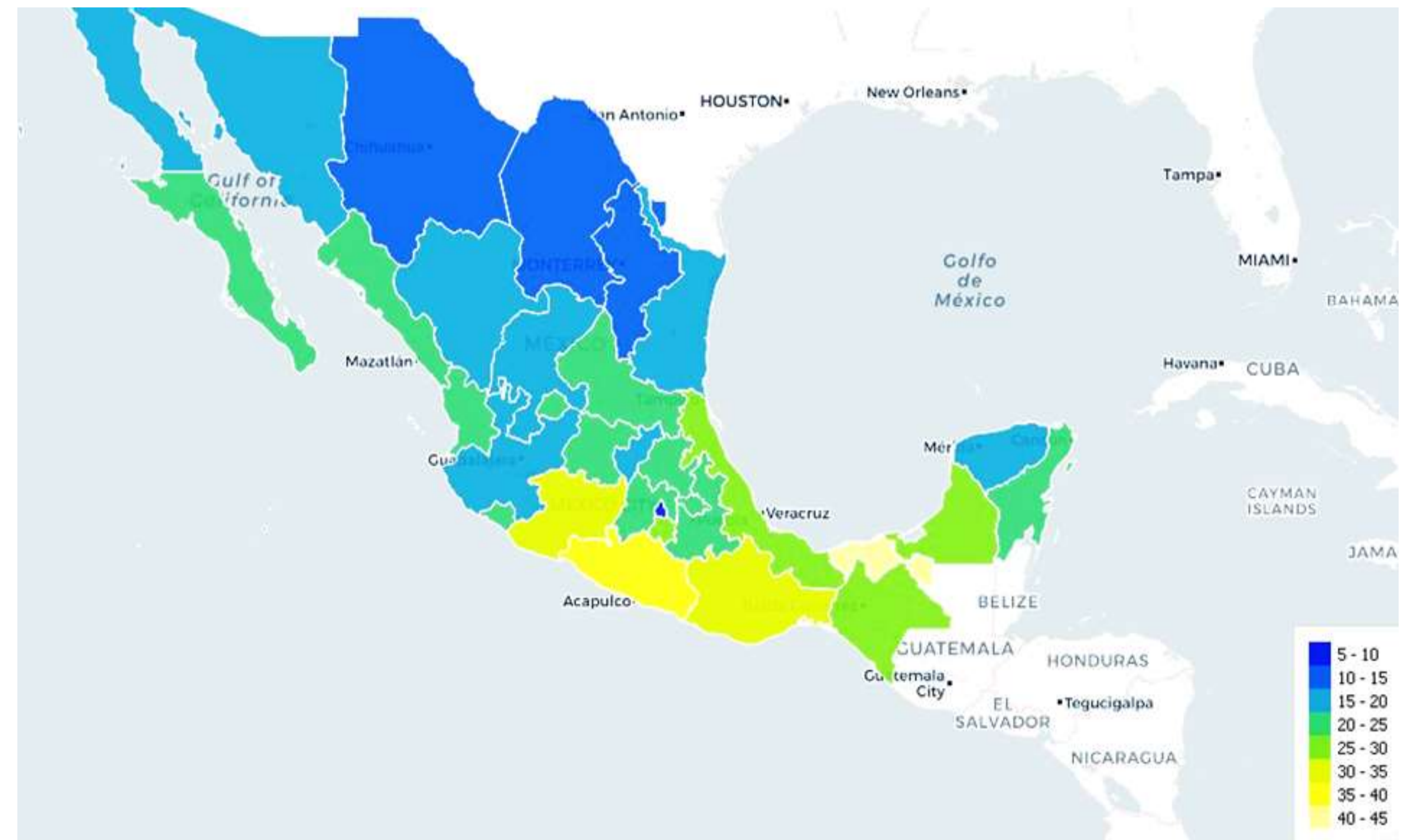
Figura 2. Proporción promedio de la población 2015 con inseguridad alimentaria por entidad federativa.

Se visualiza una disparidad entre las entidades federativas del norte y las del sur, siendo las del norte con menor proporción en comparación con las entidades federativas del sur.