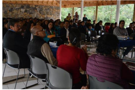
UVI cuatro vientos