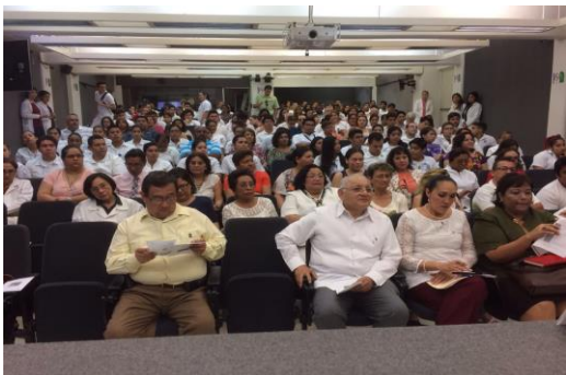
Región Veracruz-Boca del Río