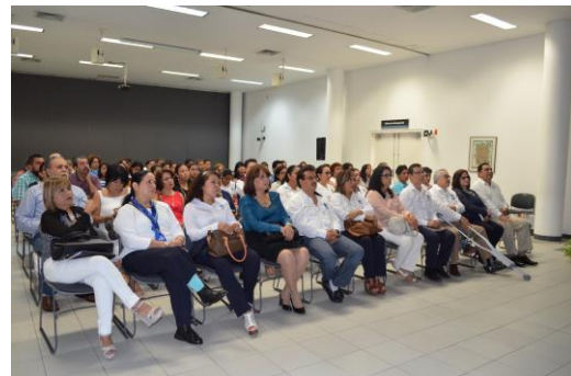
Región Poza Rica-Tuxpan