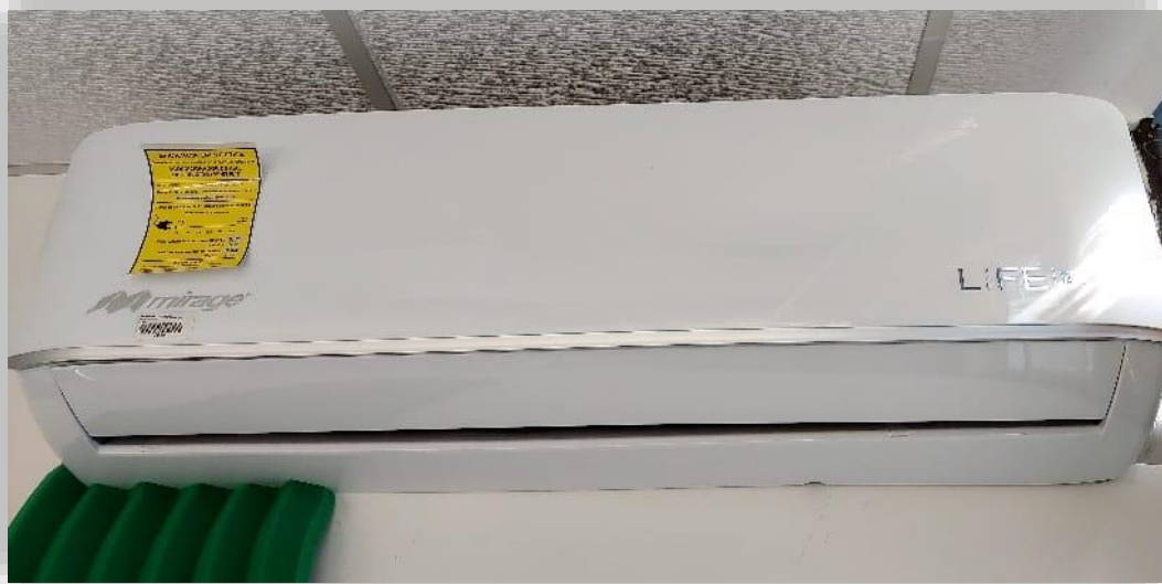
Cambio de equipos de aire acondicionado 2