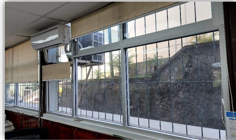
Restauración de ventanas área secretarial