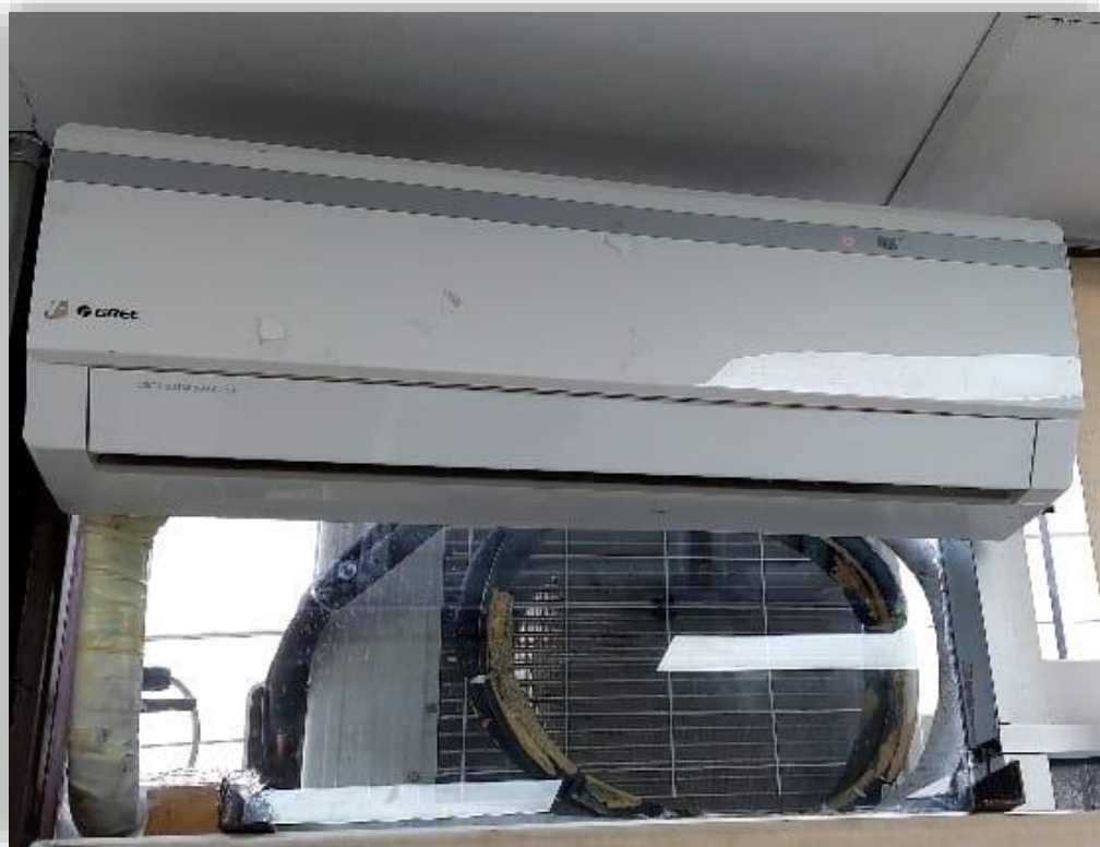
Cambio de equipos de aire acondicionado I