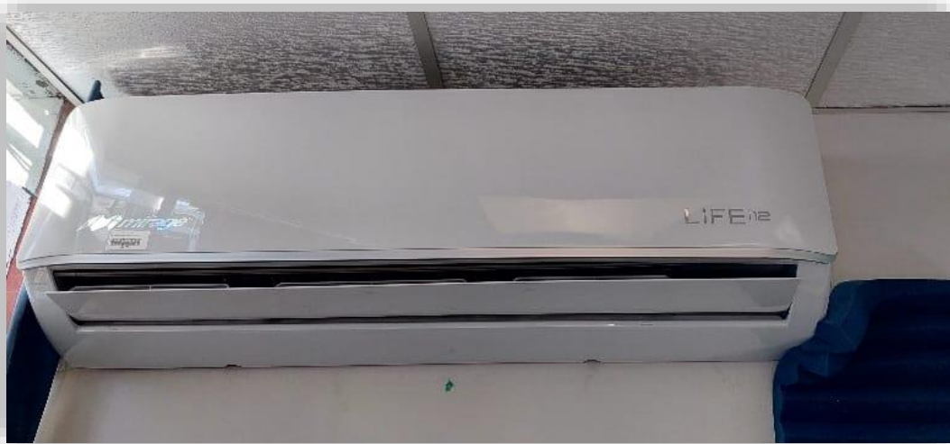
Cambio de equipos de aire acondicionado 3