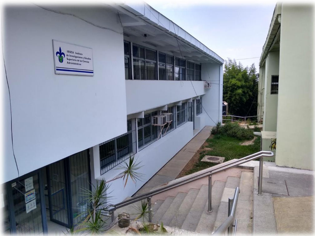
Fachada lateral del IIESCA

Ser una Institución con espíritu de colaboración y compromiso social, reconocida por su trabajo académico, líder en México en la transformación de la cultura administrativa y referente para las Instituciones de Educación Superior y de Investigación en los ámbitos nacional e internacional, buscando la excelencia en su quehacer académico, en el marco de las funciones sustantivas de la Universidad Veracruzana.