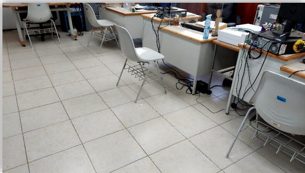
Renovación de piso área secretarial