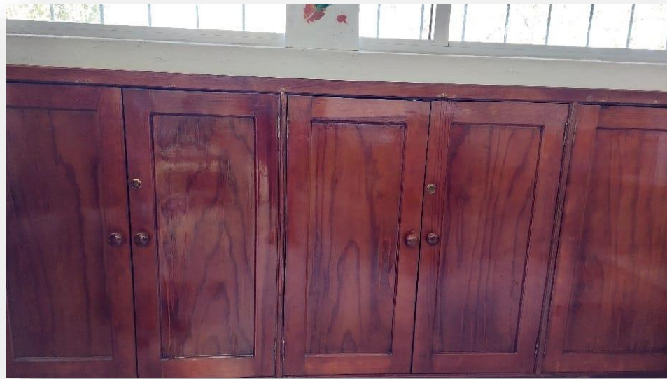
Restauración de gavetas empotradas