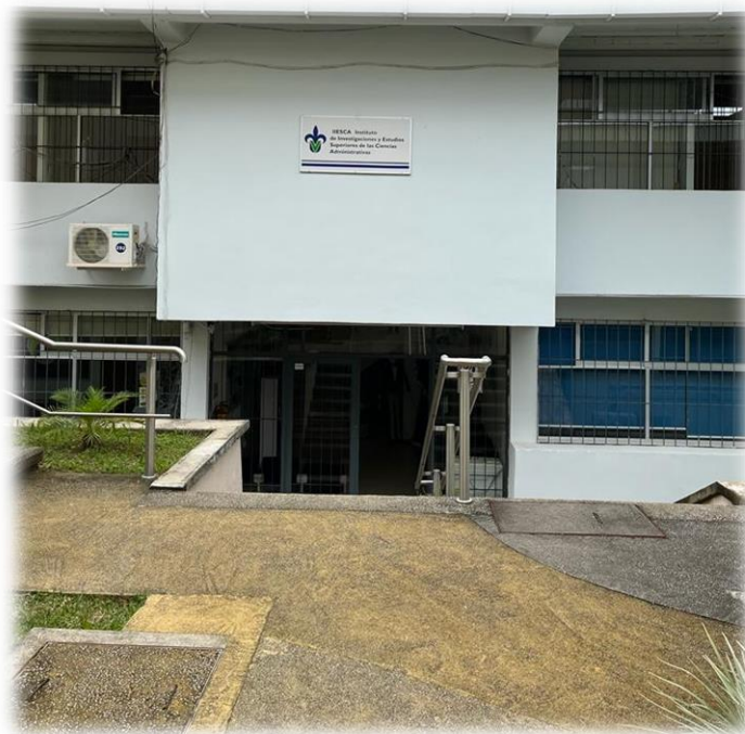
Fachada central del IIESCA

El presente informe comprende las actividades y resultados del Instituto de Investigaciones y Estudios Superiores de las Ciencias Administrativas de la Universidad Veracruzana (IIESCA) durante el período de noviembre 2021 a diciembre de 2022, con la colaboración y compromiso de todos sus integrantes. En este periodo, a pesar de seguir viviendo bajo los efectos de la pandemia COVID-19, el personal administrativo y técnico manual laboró de manera presencial de acuerdo a las indicaciones de las autoridades, mientras que la comunidad académica continuó trabajando hasta el mes de julio, principalmente de manera remota con la opción de la modalidad híbrida. Las condiciones anteriormente mencionadas, permitieron llevar a cabo con regularidad y eficiencia, las actividades académicas y administrativas, para así efectuar las funciones sustantivas y adjetivas del instituto, por ello, se presenta a su consideración el siguiente informe de labores: