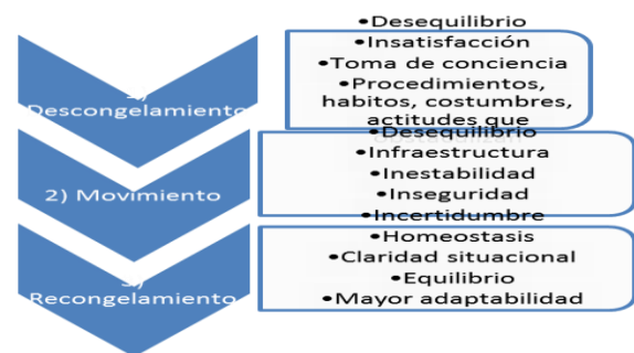
Figura 1. Etapas del proceso de cambio según Kurt Lewin

El proceso de cambio dentro de una organización según lo planteado originariamente por Kurt Lewin se desarrolla a través de tres etapas básicas: Descongelamiento, movimiento y congelamiento (González, 2012). Ver figura No. 1.