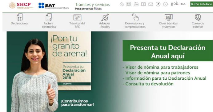
Figura 2. Análisis de la página del SAT.

La Figura 2 nos muestra el nuevo Sistema de Administración Tributaria que ahora está categorizado en 7 rubros y cada uno de ellos con la información necesaria para cumplir con tus obligaciones fiscales, en caso de no conocerlo adecuadamente es un sistema con mayor complejidad que el anterior, estas medidas fueron implementadas de acuerdo con el SAT para la facilidad del contribuyente, pero no fue así, lo que ayuda al contador público para tener mayores clientes.