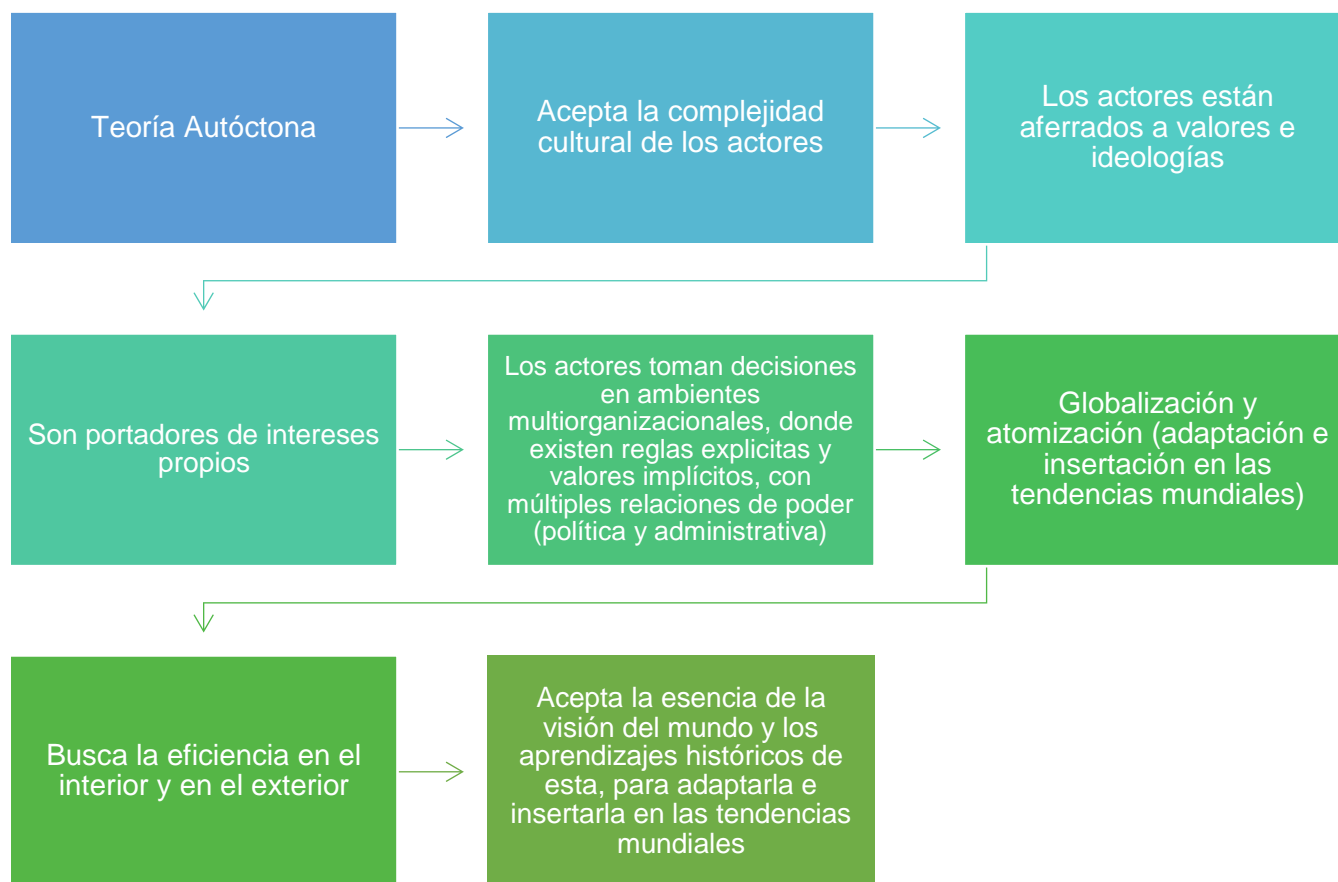
Figura 2 Características de la teoría autóctona

por otros países, pero intentar adaptarlos a su propia realidad, considerando que son modelos que se han realizado para diferentes sociedades y, a largo plazo se tienen consecuencias de eficiencia y eficacia en la gestión; cada país tiene sus propias necesidades internas y externas, es por esto que los autores Arellano y Cabrero (2000), establecen que se deben transformar o adaptar a la realidad mexicana. A continuación, se describen algunas características identificadas en el desarrollo de la investigación de la teoría autóctona.