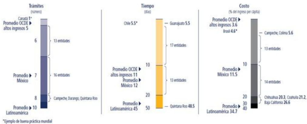
FIGURA Para alcanzar las mejores prácticas mundiales, los próximos retos serán la simplificación de trámites y disminución de costos

Fuente: Doing Business en México 2014 consultado en: