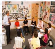
Inglés Comprensión de Textos