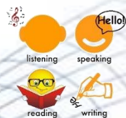
Inglés 4 Habilidades