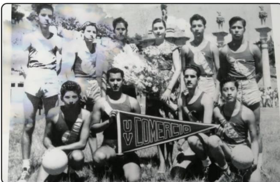
Equipo de fútbol de la Facultad