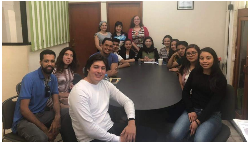
Académicos y alumnos en la FCA

La Facultad de Contaduría y Administración vive el cambio y se vuelve parte del mismo, asegurándose de mantener siempre un excelente capital humano, tanto en sus catedráticos como en sus estudiantes y profesionistas egresados, contribuyendo así, al engrandecimiento de México.