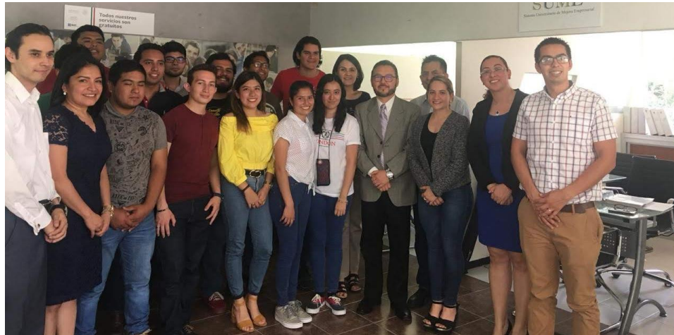
Núcleo de Apoyo Fiscal