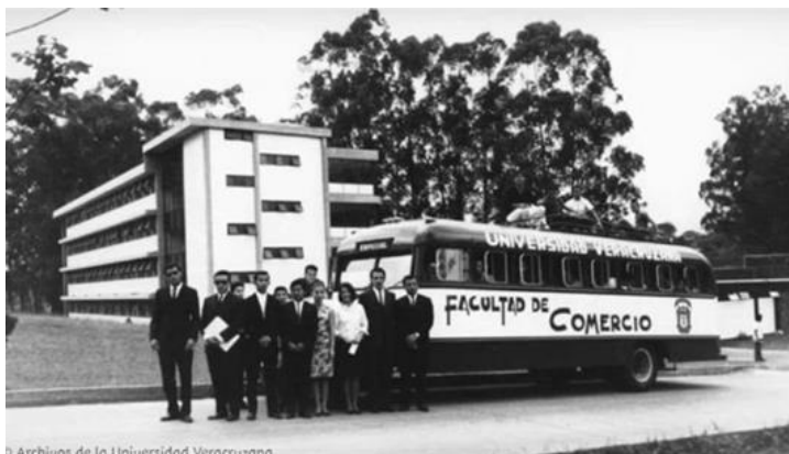
Facultad de Comercio