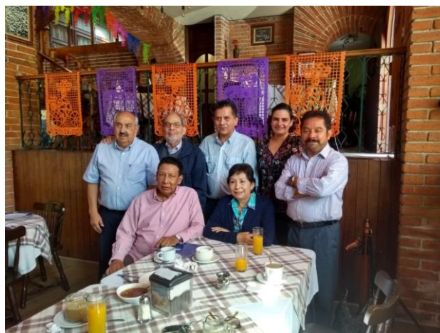
Académicos de la FCA

Para este año se rediseña el plan de estudios de Contaduría y se crean las áreas terminales con la finalidad de que los alumnos pueda especializarse en alguna de las áreas de acentuación como: Contabilidad gubernamental, Contabilidad y fiscal, Auditoría, Finanzas y Contabilidad y Comercio Exterior; contemplando en total, 324 créditos.