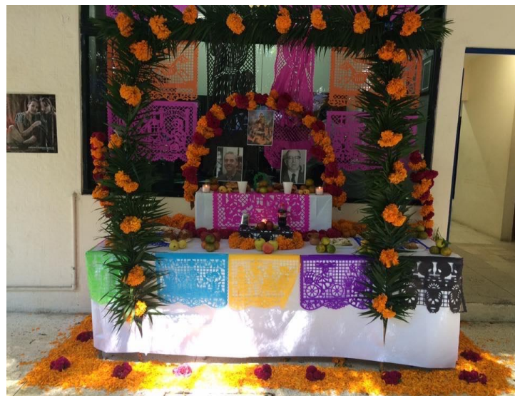
Altar montado para festividades de Día de Muertos