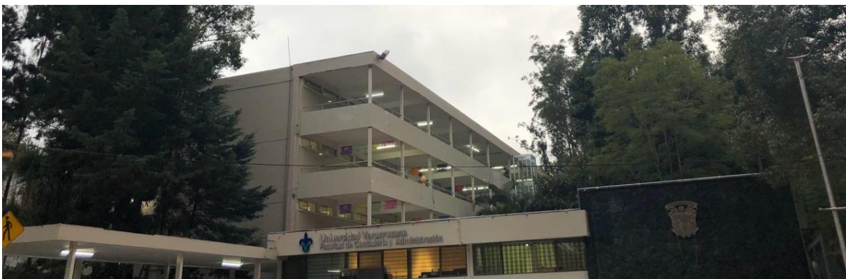
Fachada de la Facultad

La Facultad de Contaduría y Administración vive el cambio y se vuelve parte del mismo, asegurándose de mantener siempre un excelente capital humano, tanto en sus catedráticos como en sus estudiantes y profesionistas egresados, contribuyendo así, al engrandecimiento de México.