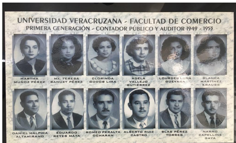
Primera generación Contador Público y Auditor