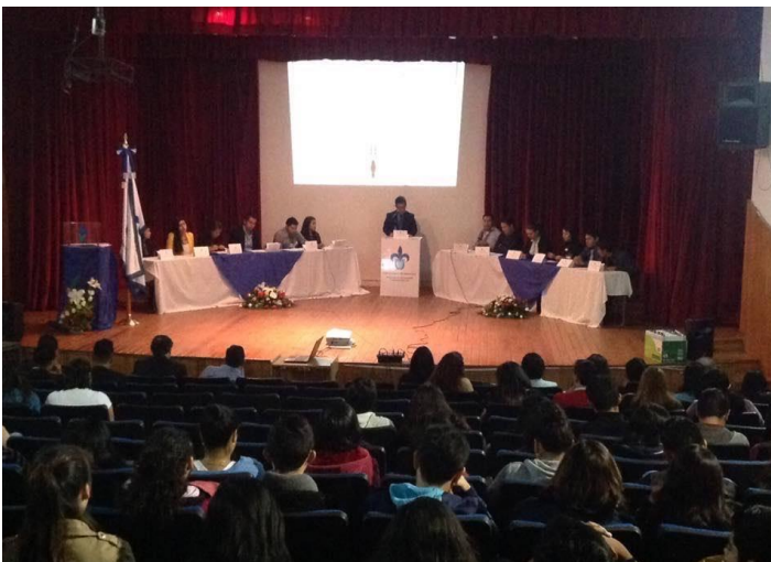
Mesa redonda en el Auditorio de la Facultad