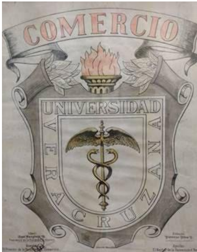
Escudo Facultad de Comercio

Fue durante la década de 1940 que un importante cambio socioeconómico surge en México. El modelo de Sustitución por Importaciones comienza a tener lugar y con él, también llegan nuevas empresas y la necesidad de contar con mano de obra y prestadores de servicios profesionales como los contadores.