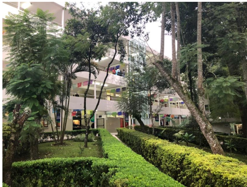
Edificio "B" FCA

Hoy en su 70° aniversario, la Facultad es una de las entidades académicas más importantes del Estado de Veracruz; cuenta con más de 2955 alumnos en sistema escolarizado, al igual que con 58 profesores de tiempo completo, 114 profesores de asignatura, 5 investigadores y 12 técnicos académicos, personal administrativo, técnico y manual 64 personas. Albergando en sus instalaciones 8 programas educativos, 4 de licenciatura y 4 de posgrados.