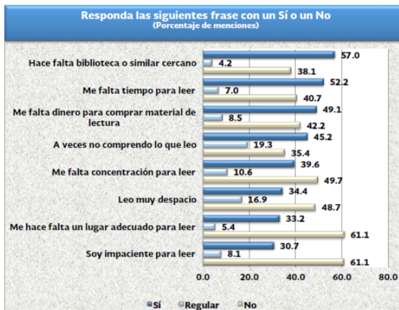
Figura 2.10. Limitantes específicas para leer reportadas por los entrevistados. Para cada pregunta suma 100% al incluir la opción "No sabe".

De las limitantes específicas, la ausencia de una biblioteca o de un lugar de fomento a la lectura y la falta de tiempo , fueron las más mencionadas por la población. La carencia de un lugar adecuado para practicar la lectura y la impaciencia para leer fueron las menos mencionadas.