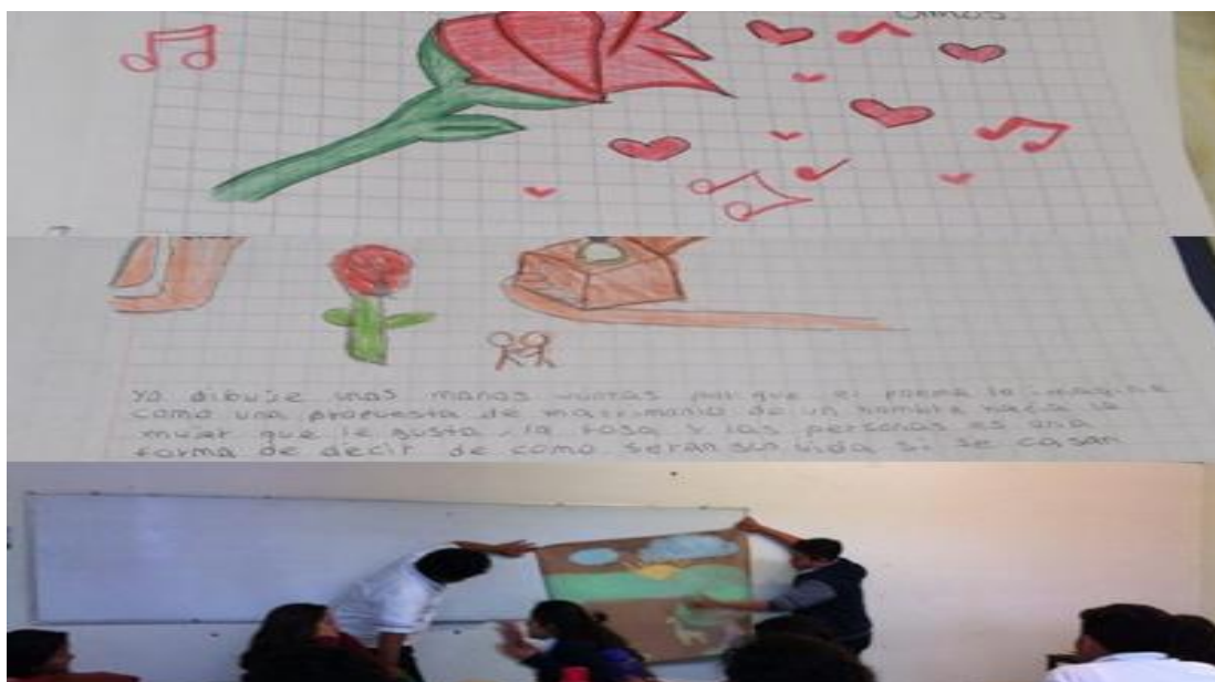
Figura 2. Dibujos.

Finalmente, se tomaron algunas fotografías y videos que evidencian el trabajo realizado por los participantes del taller de promoción de la lectura. Dichas fotografías muestran tanto las actividades individuales como las grupales. En este sentido, en una de las actividades participaron dos cuentacuentos, quienes forman parte del cuerpo docente de la institución educativa, en la que se encuentran adscritos los estudiantes (Ver anexo 8).