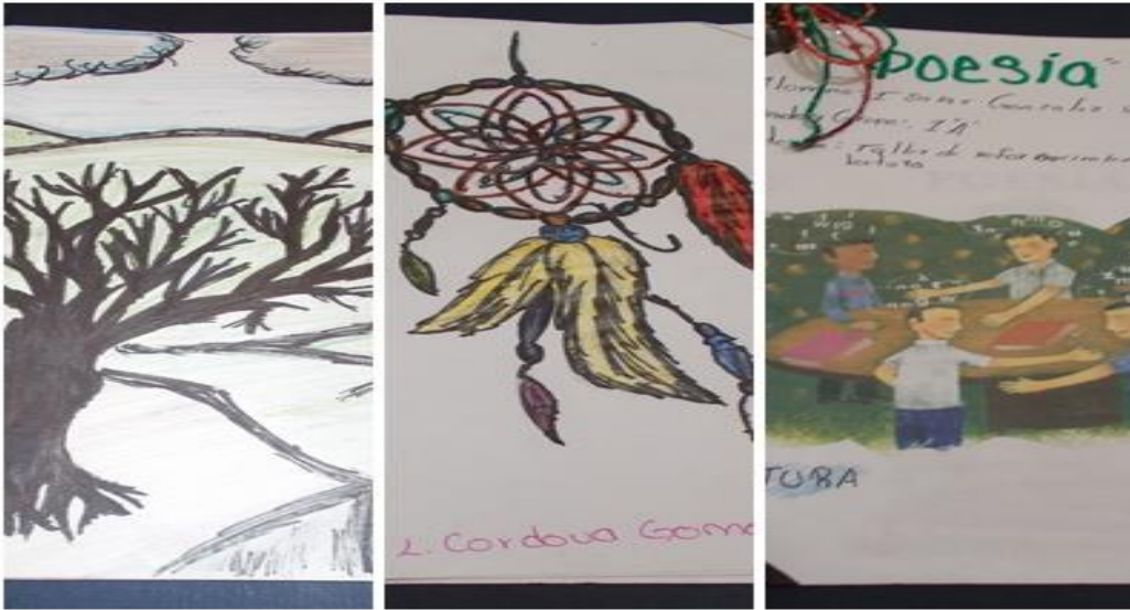
Figura 1. Portadas de antologías

Como parte de una actividad, los estudiantes inventaron una historia relacionada con la imagen de un barco que fue mostrada. Los resultados fueron sorprendentes. Varios estudiantes escribieron una cuartilla o más, en la cual narraron su propia historia. Los participantes del taller tienen una imaginación extraordinaria. A continuación se exponen dos transcripciones de los textos redactados: