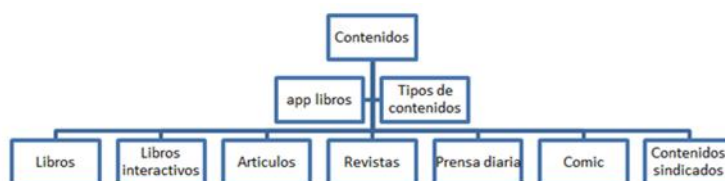
Figura 1.1 Aplicaciones de lectura. Cordón y Gómez (2013). Diccionario de nuevas formas de lectura y escritura.

Para leer en los dispositivos ya mencionados, se necesitan ciertas aplicaciones de lectura, es decir software especializado en visualización de textos; para Gómez y Cordón (2006), las aplicaciones de lectura son programas informáticos que permiten al lector acceder principalmente a textos facilitándole el manejo del contenido; para la utilización de estas aplicaciones de lectura se necesita tener en cuenta algunos aspectos, como el sistema operativo que utiliza el dispositivo, el formato del texto, diferenciar entre un libro, una revista, comic, etc.; saber si tiene elementos adicionales como video, sonido o vínculos a otros sitios u otros recursos. “La relación entre el autor, lector y el libro se transforma vertiginosamente sobre todo entre las nuevas generaciones que utilizan la red cómo una experiencia de socialización” (Cordón 2010, pag.14).