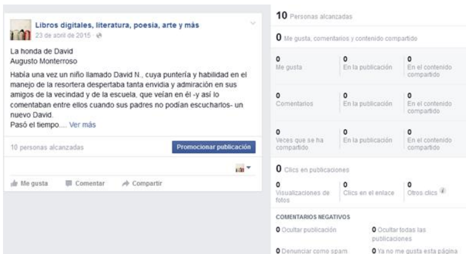
Figura 1.4. Captura de pantalla de estadística de la publicación.

Dentro de las actividades de promoción de la página de Facebook, se compartió una presentación realizada en Prezzi, para invitar a la comunidad universitaria a visitar la página, consistió en una pequeña semblanza biográfica titulada, Vida y obra de Eraclio Zepeda, autor mexicano, y un cuento con audio del mismo, se compartió en la misma página, así como en las redes sociales de la USBI.