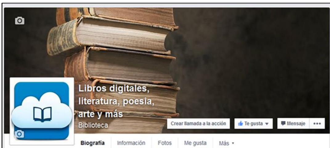
Figura 1.2. Captura de pantalla de imagen de portada de la página de Facebook.

Como ya se mencionó anteriormente además de material de lectura, se publicaron otros materiales como videos cortos y material de contenido diverso, a continuación se detalla el proceso de trabajo en el siguiente esquema, el cual se presenta en la Figura 3.