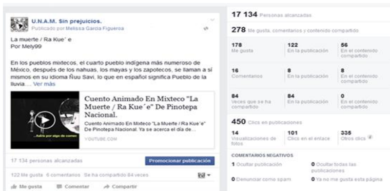
Fig. 1.7. Captura de pantalla de página de Facebook U.N.A.M sin prejuicios.

Esta página pertenece a egresados de la UNAM, y tiene como finalidad compartir contenido “libre”, es decir, de casi cualquier tema, esta página lleva casi tres años publicando en Facebook. Una de las ventajas es que los contenidos llegaron a más personas, como se observa en la imagen a casi dieciocho mil, ya que cuenta con 287, 443 seguidores, que son muchos más en comparación a los 35 de la página de nueva creación de este proyecto.