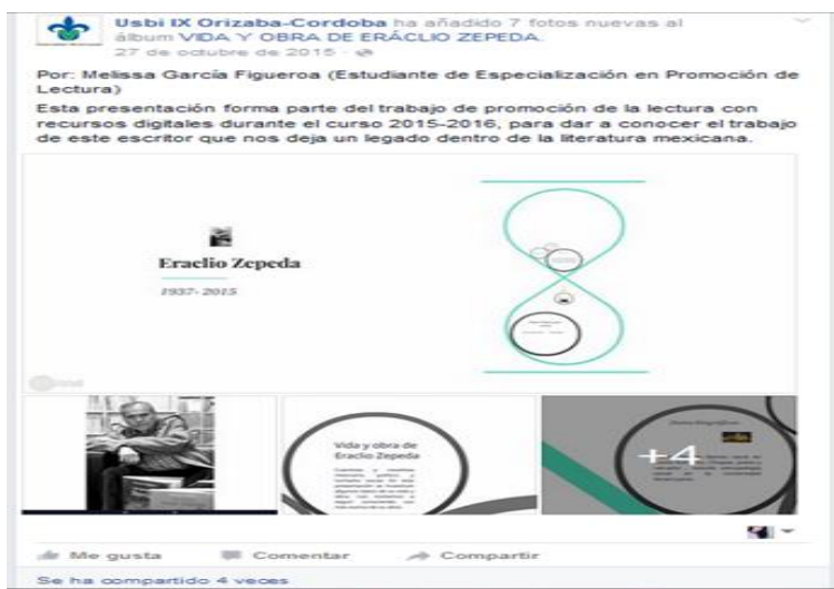
Figura 1.5. Captura de pantalla de Facebook.

Dentro de las actividades de promoción de la página de Facebook, se compartió una presentación realizada en Prezzi, para invitar a la comunidad universitaria a visitar la página, consistió en una pequeña semblanza biográfica titulada, Vida y obra de Eraclio Zepeda, autor mexicano, y un cuento con audio del mismo, se compartió en la misma página, así como en las redes sociales de la USBI.