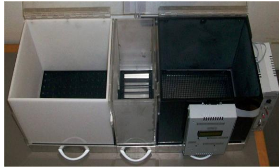
Figura I. Caja de Preferencia de lugar condicionado automatizada, utilizada en nuestro experimento. Las ratas pueden distinguir la diferencia física entre los compartimentos laterales ya que estos tienen diferentes colores y piso de diferente textura.

todos los compartimentos y contabilizando el tiempo que permanece en cada uno. El compartimento en el que permanece por más tiempo se considera su preferido. Durante las sesiones de condicionamiento el animal es colocado en el compartimento no preferido cada vez que se le da el estímulo a medir (sexo, drogas, juego) y en días alternos se coloca en el compartimento preferido en ausencia del estímulo evaluado.