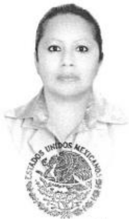
Secretaría de Educación Pública PUEBLA, PUE.